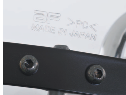
タレ(コーデュラ1000ブラック)