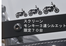
風防用ポリカーボネイト