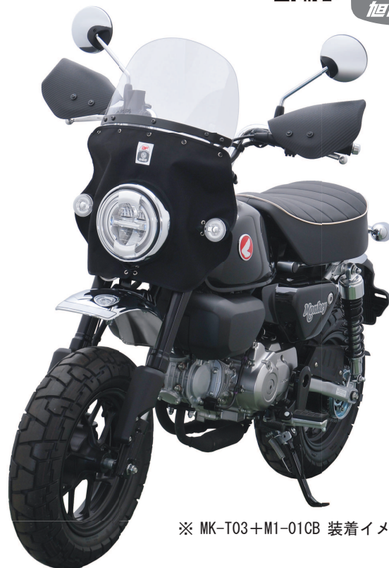
※ MK-T03+M1-01CB 装着イメージ