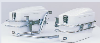
AC-2 (デラックスタイプ※/スタンダードタイプ)

デラックスタイプ ¥36,900 (消費税別) スタンダードタイプ ¥34,700 (消費税別)