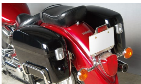
AC-31 YAMAHA ドラッグスターシリーズ専用