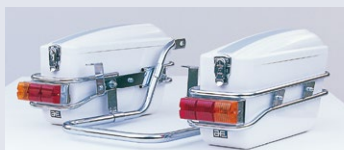
AC-1 (デラックスタイプ※/スタンダードタイプ)

片側で20リットルの大容量収納スペースを持つ2つのボックス内にはツーリングに持っていきたいアイテムをたっぷり収納できます中にはあえて仕切りを設けずに広いスペースを確保しました。使用するシーンに合わせた自分流のパッケージを作れば使い方も一層広がります。