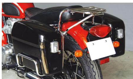
AC-36 Kawasaki W650/400専用